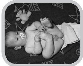
welke systemen bestaan er?