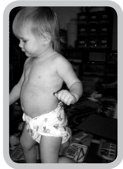
De ouders van mijn opvangkindjes zijn erg tevreden met de keuze voor wasbare luiers, het bespaart hen een hoop tijd en geld.